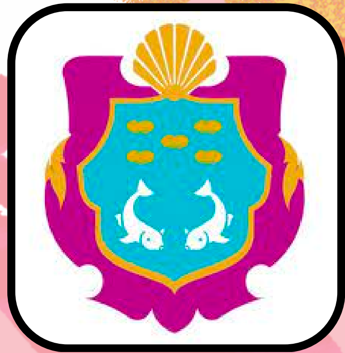
Ajuntament de Marratxí